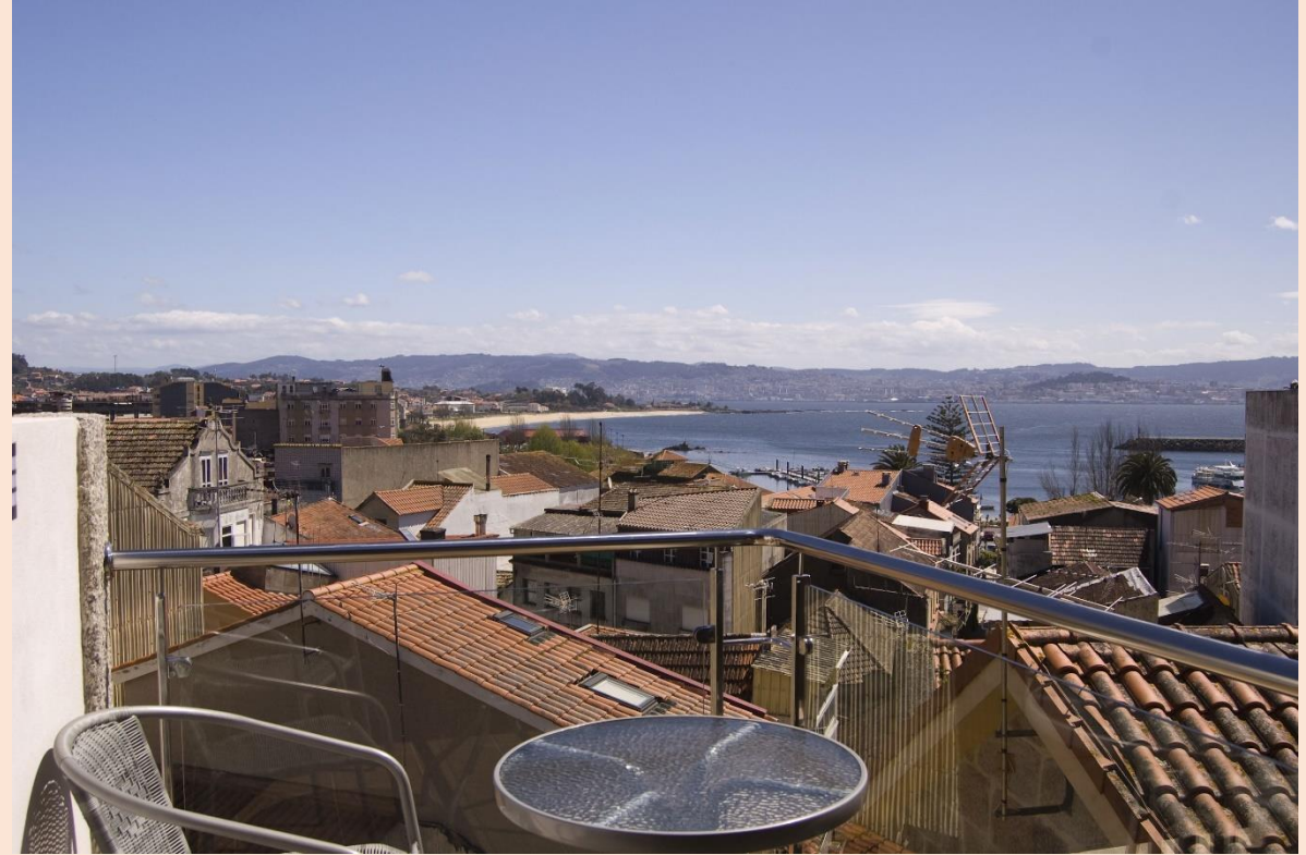
Y aquí la “joya de la corona”: la habitación del ático, con su cama de 1,50 y sus espléndidas vistas