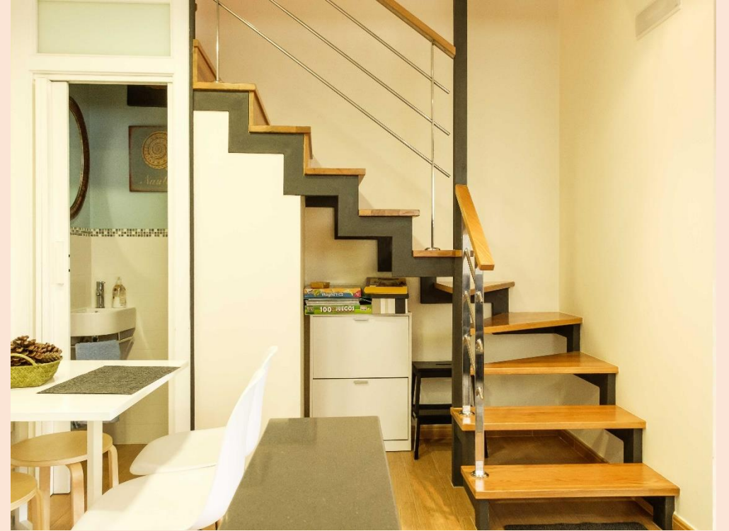
La cocina, pequeña pero suficiente y bien dotada, el aseo y la bonita escalera