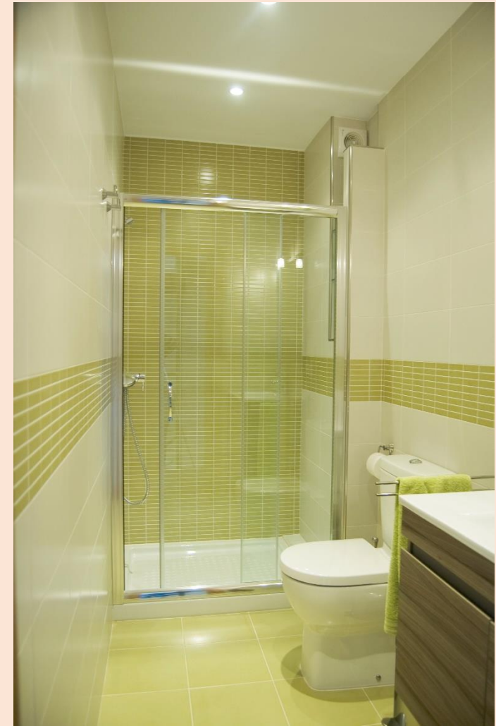
La zona de comer y el baño principal